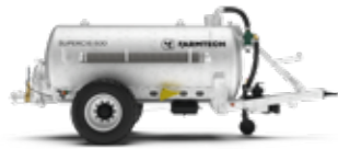
SUPERCIS 500 / 650