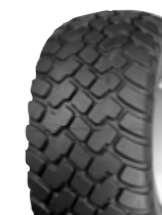
390 | 390 HD