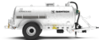
SUPERCIS 800 / 1000