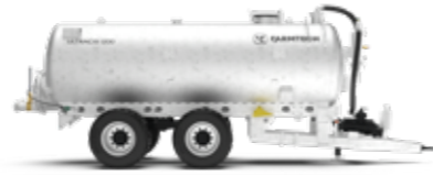
ULTRACIS 1200 / 1550