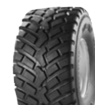
FL693 | FL693M