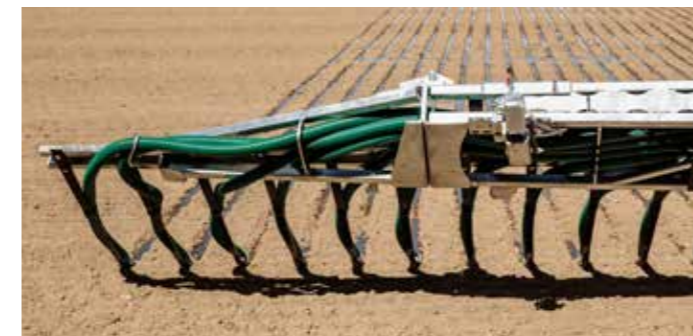
Vonótömlő távolsága 25 cm helyett 30 cm

• Szériafelszerelés + Rendelhető opciók / Nem rendelhet