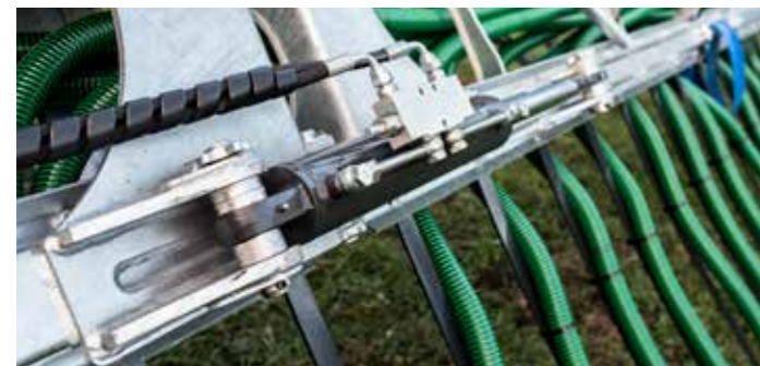
A behajtható karok hidraulikus reteszelése

• Szériafelszerelés + Rendelhető opciók / Nem rendelhet